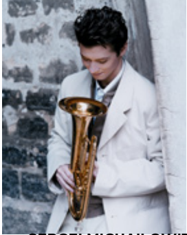
SERGEI MICHAJLOWITSCH NAKARIAKOV